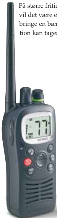
Eksempel på en bærbar VHF

På større fritidsfartøjer med redningsflåde vil det være en ekstra sikkerhed at medbringe en bærbar VHF, som i en nødsituation kan tages med over i redningsflåden.