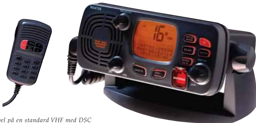
Eksempel på en standard VHF med DSC